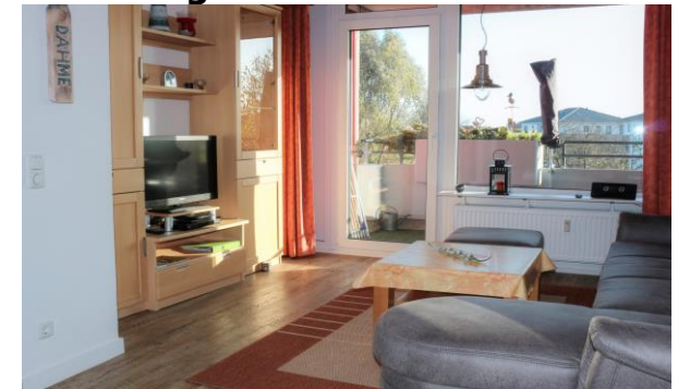
Das Wohnzimmer mit Fernsehecke und Ausgang zum Balkon