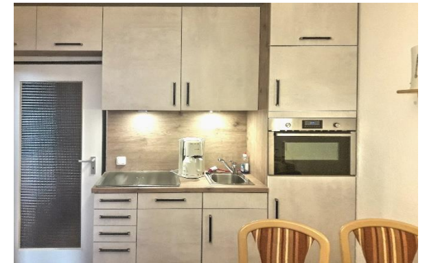
Die voll ausgestattete Küche